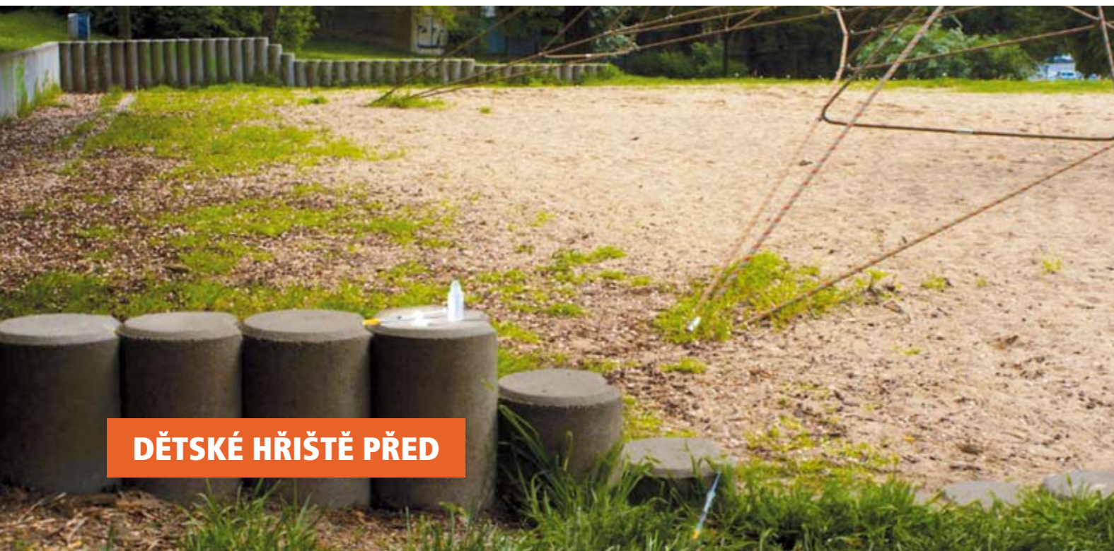
DĚTSKÉ HŘIŠTĚ PŘED