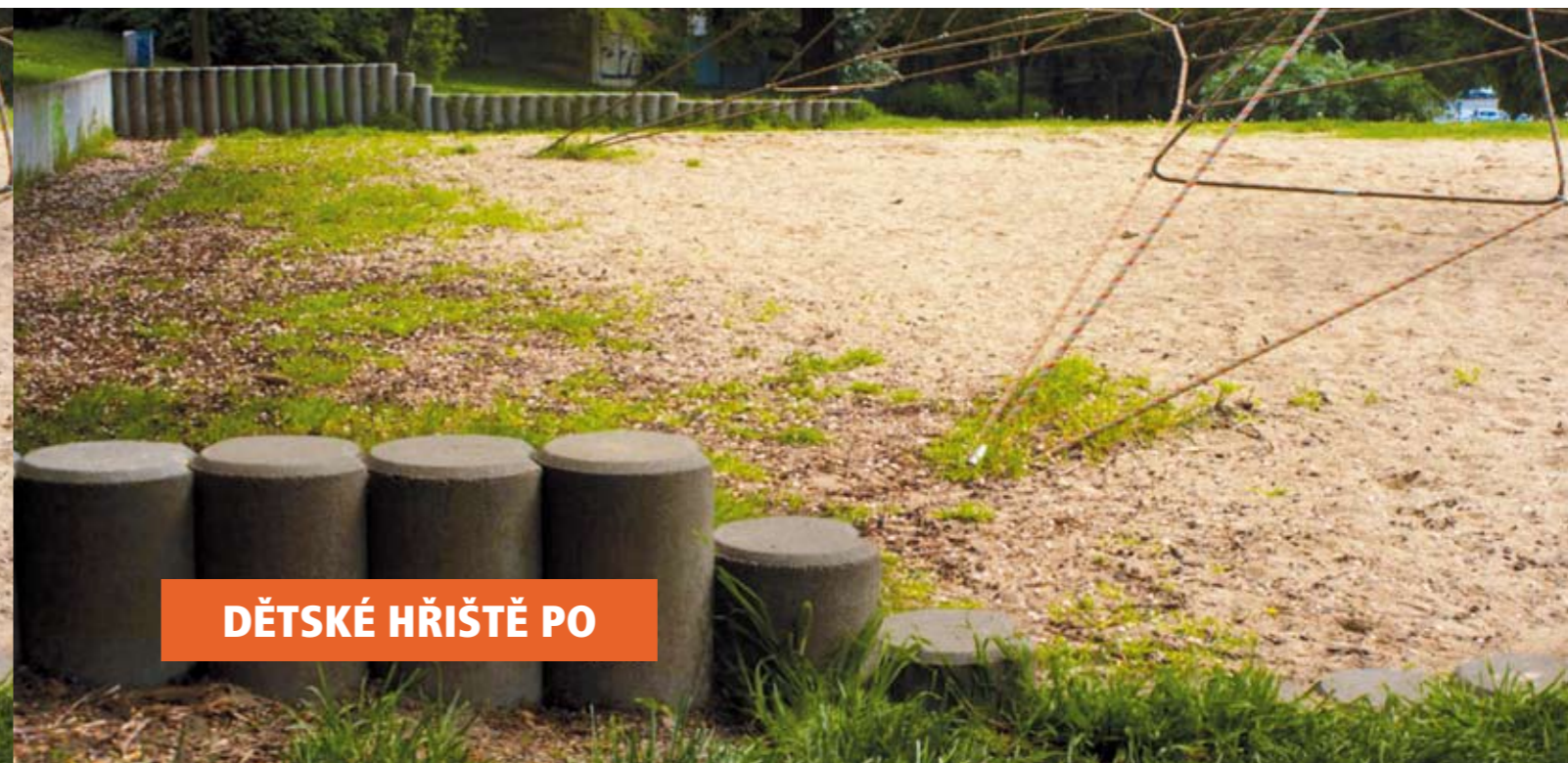
DĚTSKÉ HŘIŠTĚ PO